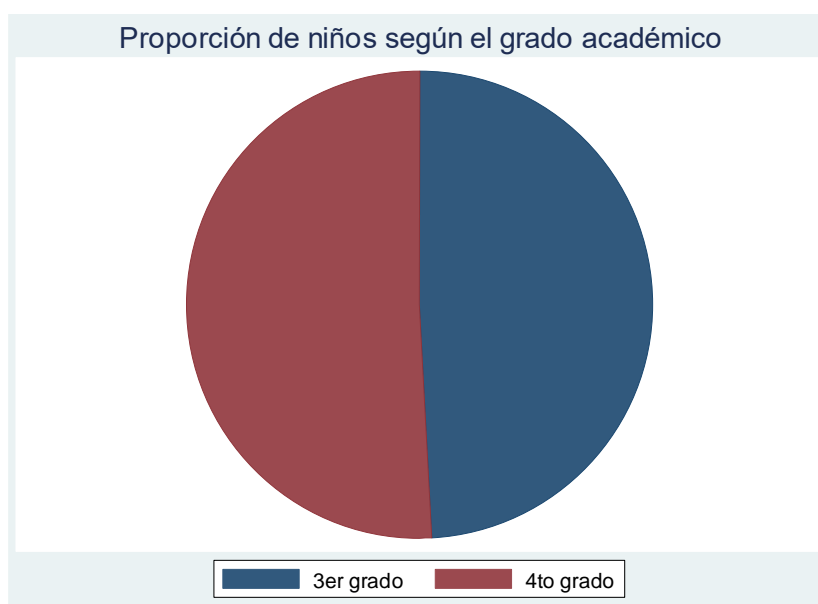
Figura 6. Proporción de niños según el grado académico de la muestra analizada.

Las proporciones de edades (en años) fue bastante similar para las edades de 11, 12 y 13 años en la muestra analizada.