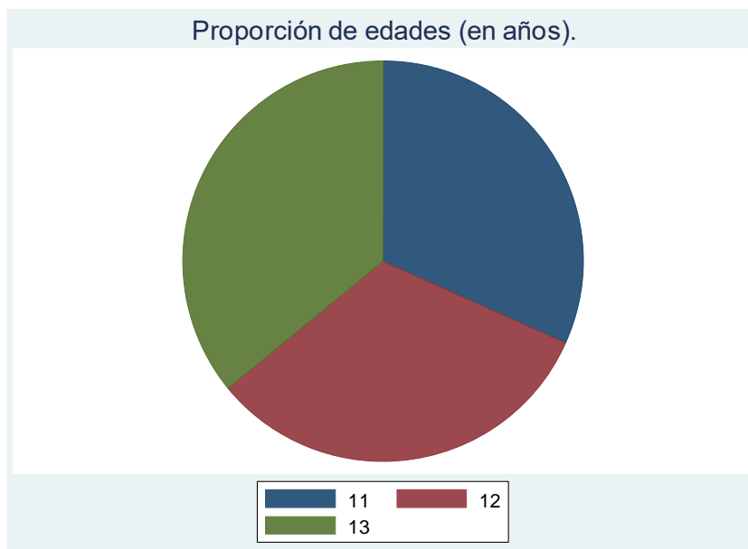
Figura 5. Proporción de edades (en años) de la muestra analizada.

Las proporciones de edades (en años) fue bastante similar para las edades de 11, 12 y 13 años en la muestra analizada.