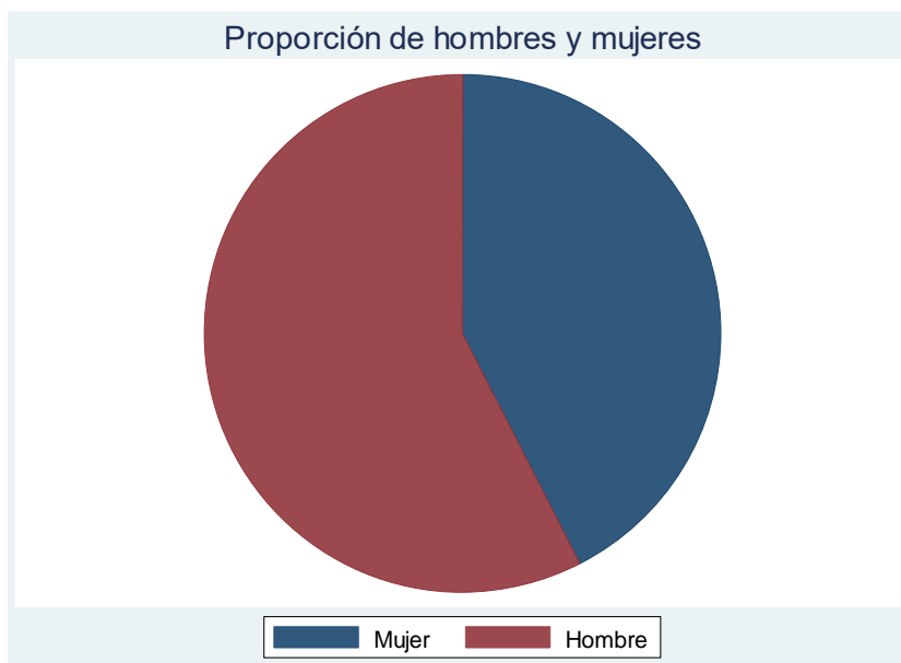
Figura 4. Proporción de hombres y mujeres de la muestra analizada.

En relación a la proporción del estado gingival en niños de 11 a 13 años, la figura 3 muestra en su mayoría inflamación moderada (95%) y con porcentajes muy bajos de inflamación leve (3,33%) e intensa (1,67%).