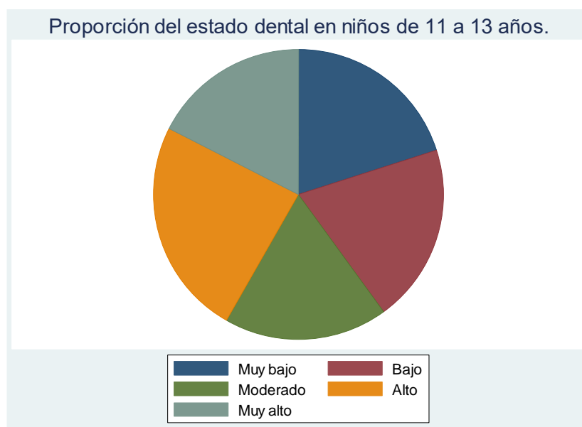
Figura 2. Proporción del estado dental en niños de 11 a 13 años de la muestra analizada.

En la figura 1, se observa la distribución del nivel de estrés percibido en niños de 11 a 13 años, en donde la mayoría tiene niveles cercanos a la media de 29,8 \pm 4,37 .