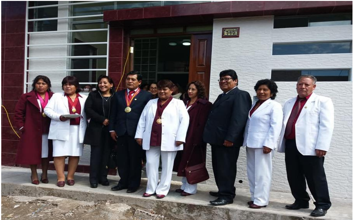
Anexo 5: Invitados En La Primera Reunión Del Año 2017