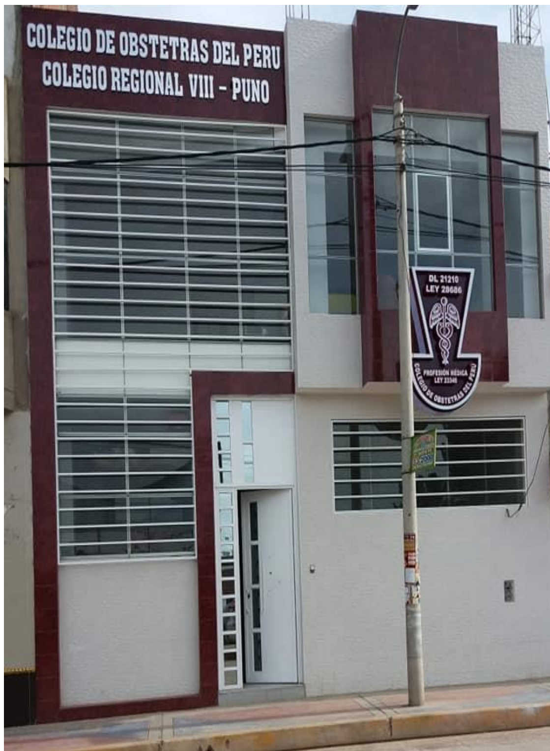
Anexo 3: Sede Central Del Colegio De Obstetras De Puno