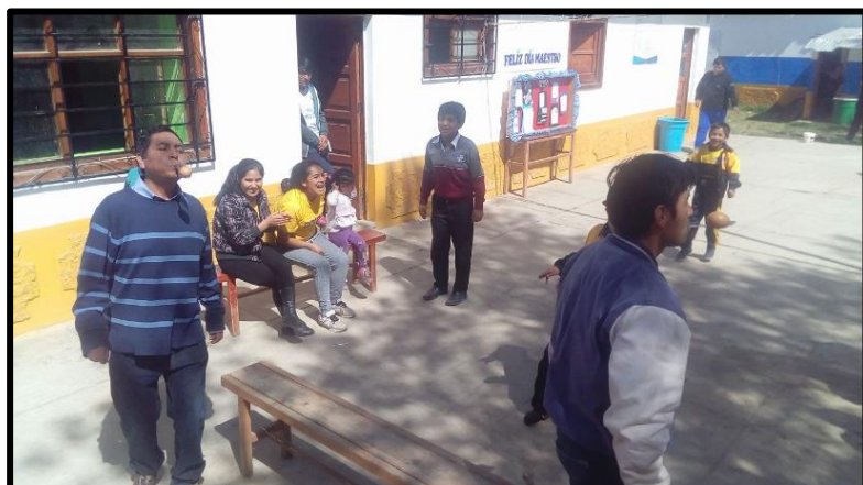
Figura 4 Estudiantes del nivel primario