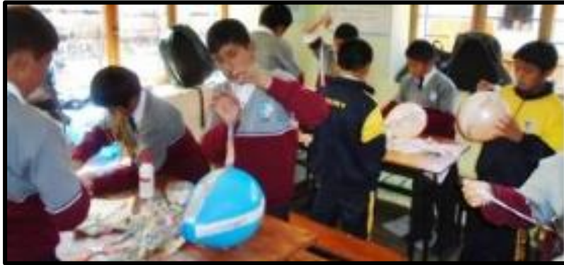
Figura 5 Estudiantes del nivel secundario