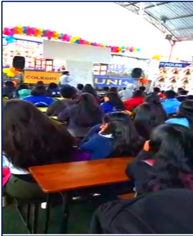
Figura 3 Estudiantes en Actividad Escolar