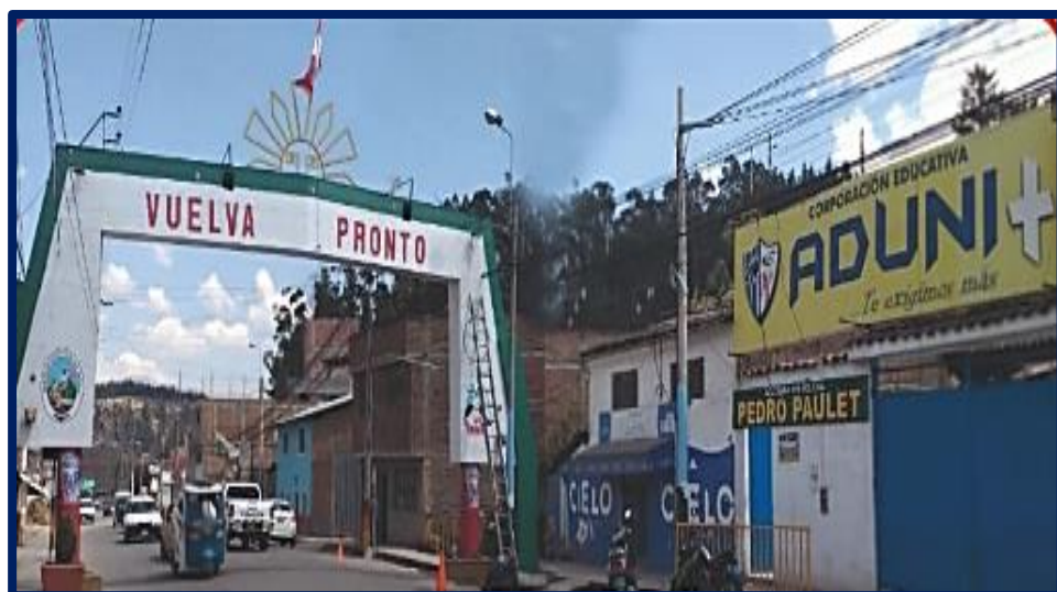
Figura 2 Instalación del Colegio ADUNI +