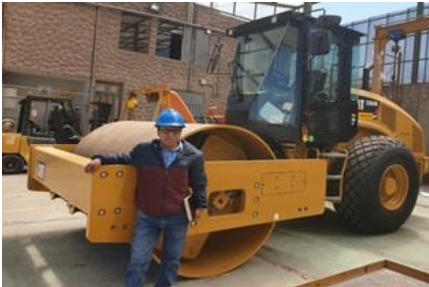
Figura: Alquiler de maquinarias

también los actos de discriminación que algunas personas son objeto en nuestra sociedad.