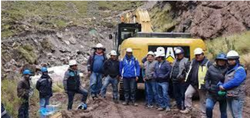
Figura: Construcción de obras

La empresa como toda organización consciente de que el planeamiento estratégico es el camino a seguir para marcar diferencias con los demás, tiene un plan estratégico, dentro de los cuales ha definido claramente su misión y visión, tal como mostramos a continuación: