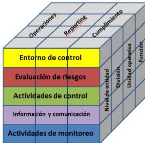
Figura N.º 2 Representación del sistema de control interno según COSO 2013

En 2013 se publicó la tercera versión, COSO III. Esta revisión del marco COSO de riesgos se centró en mejorar aspectos como la agilidad de los sistemas de gestión de riesgos, una mayor concreción en lo que se consideraba comunicación e información, un mayor énfasis en la eliminación de riesgos, y la incorporación clara del concepto “consecución de los objetivos”.