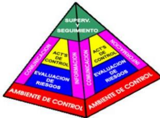
Figura N.º 1 Representación del sistema de control interno según COSO 1992