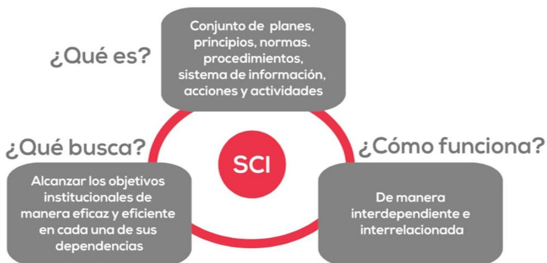
Figura: Sistema de control interno

Según el portal Actualícese (2021), El control interno es el plan de una organización para crear principios, métodos y procedimientos que sean