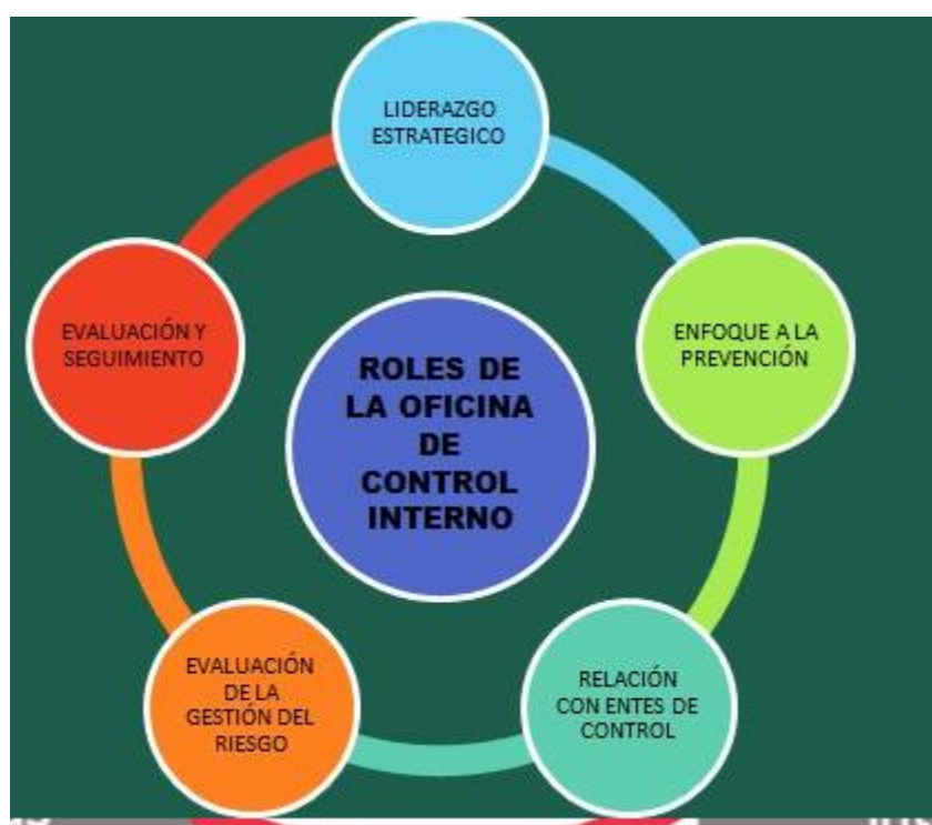
Figura: Rol de la oficina de control interno

El control interno nos permite observar la eficiencia y eficacia de las operaciones y la confiabilidad de la contabilidad, convirtiéndolo en un aspecto esencial del gobierno corporativo. Al respecto, la NIA 400 define el sistema de control interno de la siguiente manera. Todas las políticas y procedimientos adoptados por la administración de la empresa para ayudar a lograr los