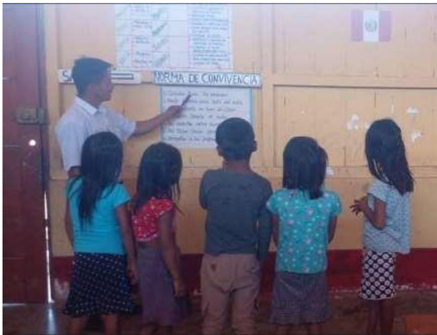
Realizando el ejercicio de unir letras para formar palabras