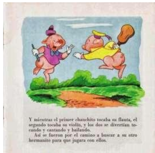
Ilustración con texto