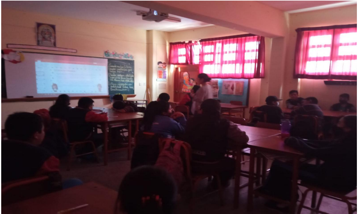
Los estudiantes del 6to. Grado respondiendo el test de “Estilos de crianza”