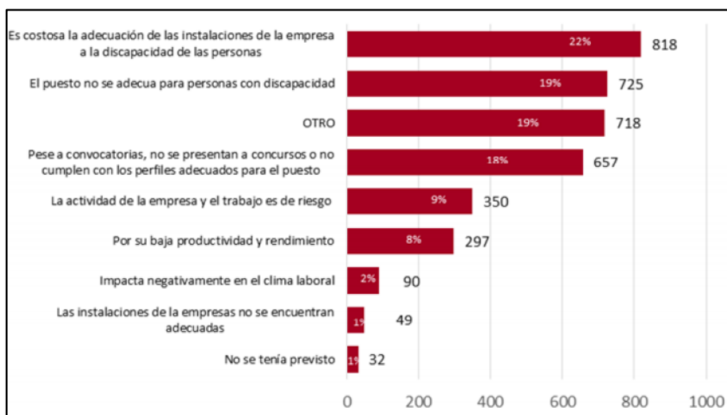
Gráfico: Razones de las empresas para no contratar Personas con Discapacidad, 2012