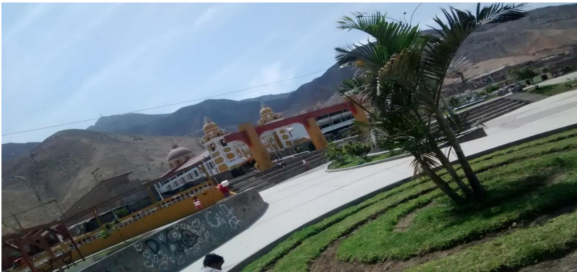
Anexo 8 : Clasificación de parques; poco amigable (Parque portada II Manchay).