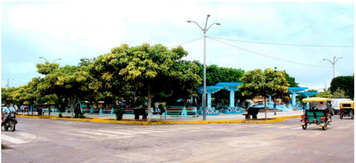
PLAZA DE ARMAS DE LA MUNICIPALIDAD DISTRITAL DE LAS LOMAS

El 03 de abril de 1936, el congreso de la república, mediante la ley N°. 8231 decretó la creación del distrito Las Lomas, el territorio que actualmente ocupa el pueblo de Las Lomas, pertenecía a la hacienda Suipirá. En 1827 el dueño de esta