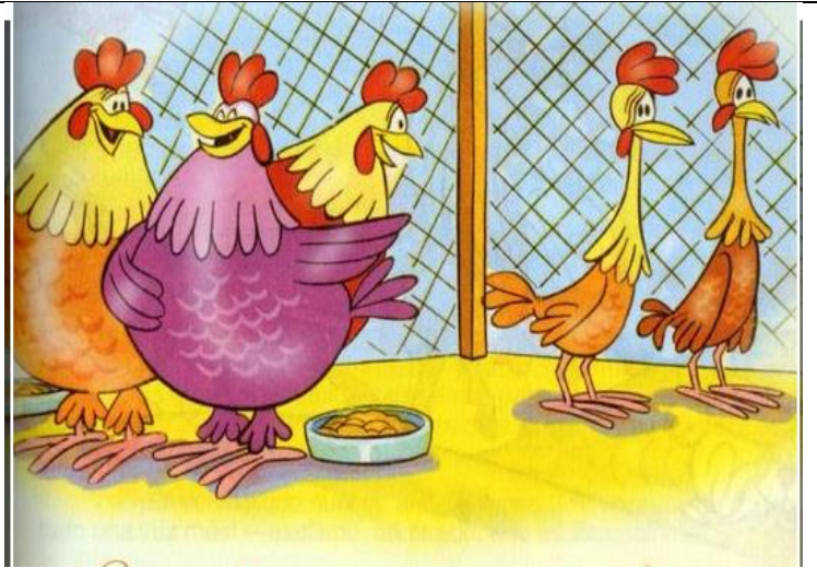
LAS GALLINAS GORDAS Y LAS FLACAS

.. LAS GALLINAS GORDAS SE BURLABAN DE LAS FLACAS LLAMANDOLAS ESQUELETICAS, MUERTAS DE HAMBRE... .. Y COMO ERAN MAS ROBUSTAS Y FUERTES, NO LAS DEJABAN COMER ..... ... LLEGO UN DIA DE FIESTA .. Y CLARO LAS GALLINAS GORDAS FUERON LAS ESCOGIDAS. . . .