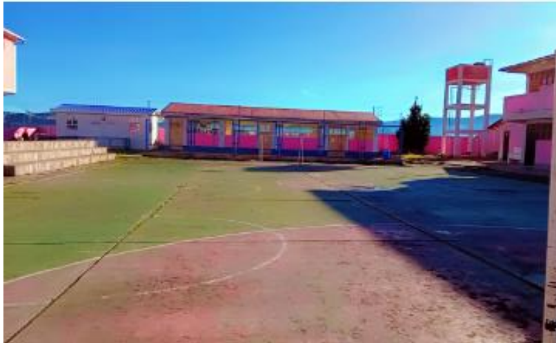
Figura 04. En la foto se aprecia la zona de juegos tradicionales de nuestra Institución Educativa Secundaria Juan Bustamante Dueñas de Lampa.