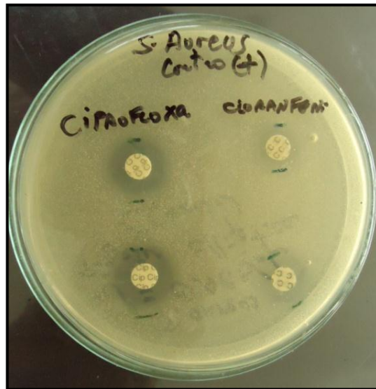
FIGURA N°4. Control positivo Antibiograma de S.aureus efectuado por método de Kirby-Bauer. Se aprecia ligera resistencia a cloranfenicol (Ram)