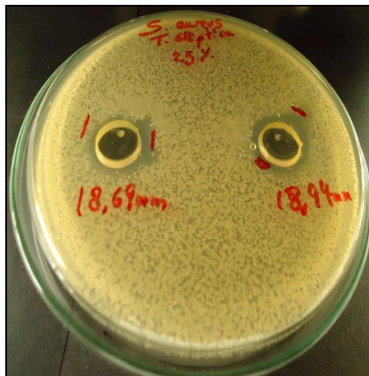
FIGURA N° 5 Resultado obtenido a una concentración de 25 %