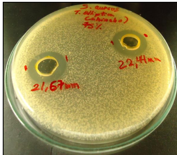
FIGURA N° 7 Resultado obtenido a una concentración de 75 %