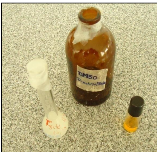
FIGURA N°3. Dimetilsulfoxido (DMSO) medio de dilución del aceite esencial de Tagetes elliptica .