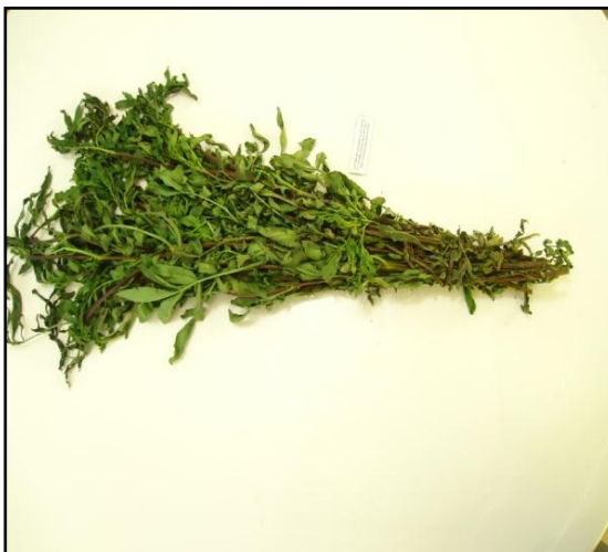
FIGURA N° 2. Hojas de Tagetes elliptica "chinchu"