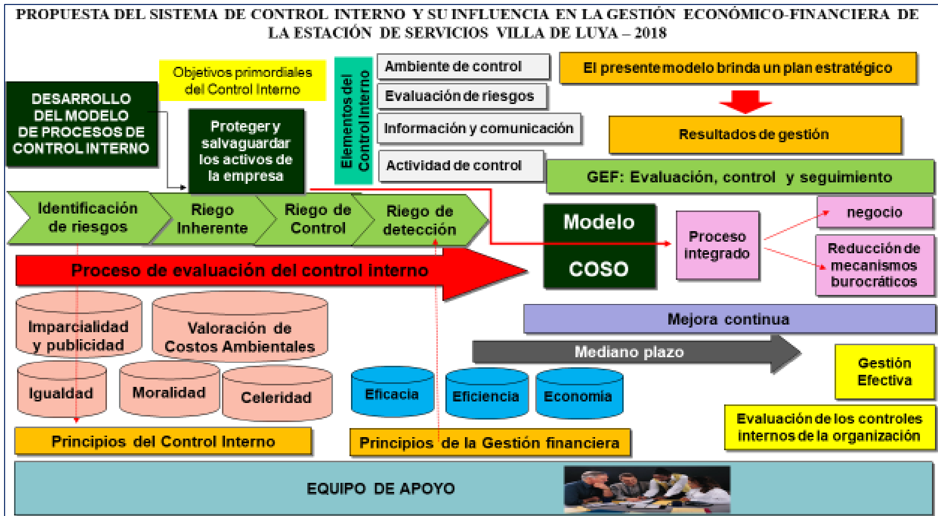
Figura 3.4 Propuesta del Sistema de Control