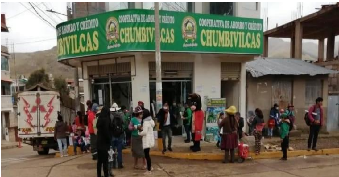
Imagen de la Oficina de la Cooperativa de Ahorro y Crédito Chumbivilcas – COOPAC Chumbivilcas.

Nota: la imagen fue obtenida por una cámara fotográfica personalmente.