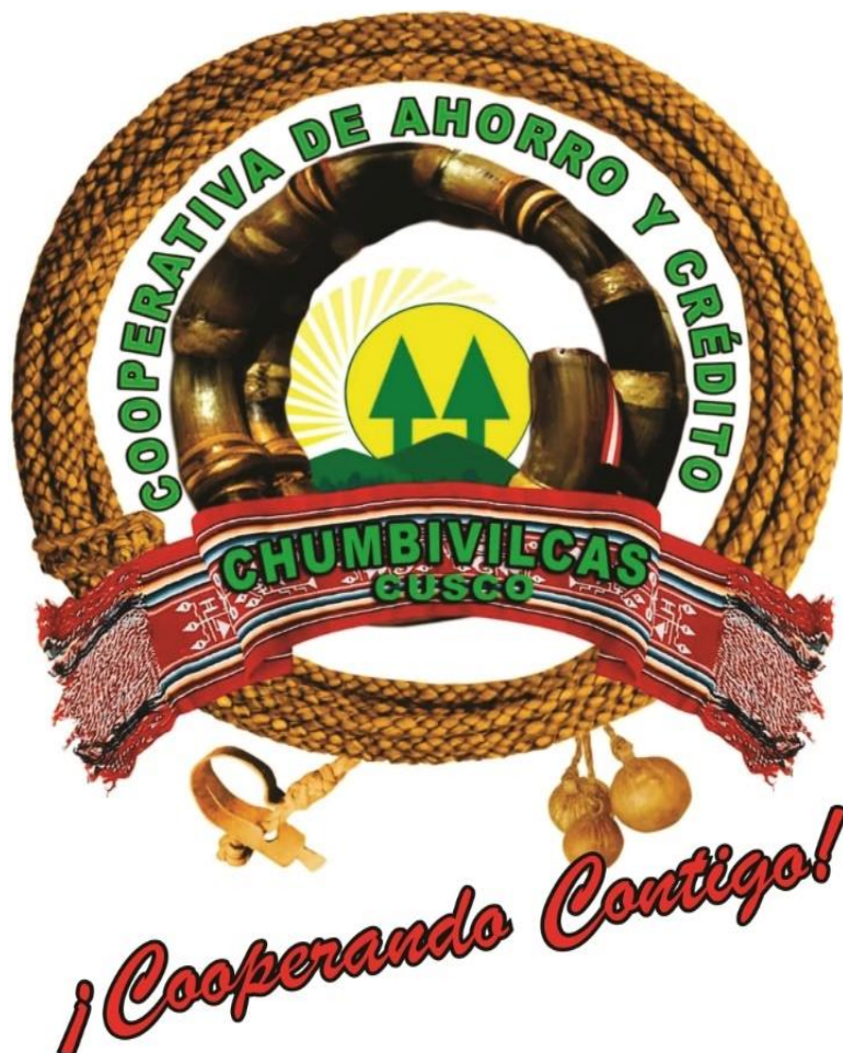
Imagen de la razón social de la cooperativa de ahorro y crédito de Chumbivilcas – COOPACC Chumbivilcas.

Nota. La imagen de la razón social de la cooperativa de ahorro y crédito de Chumbivilcas – COOPACC Chumbivilcas, se obtuvo de su MOF.