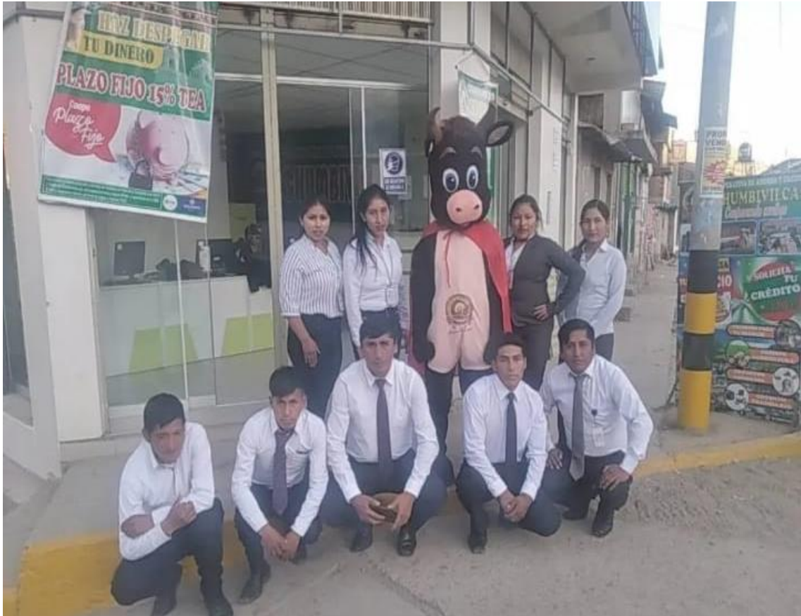
Imagen del Personal administrativo de la Cooperativa de Ahorro y Crédito Chumbivilcas – COOPAC Chumbivilcas.

Nota. La imagen fue obtenida por una cámara fotográfica personalmente.