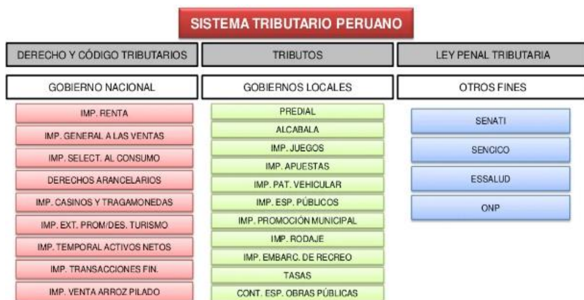
Figura: Sistema tributario nacional, cobranza de tributos.

entes recaudadores de los tributos en general, tal como se muestra en la siguiente tabla: