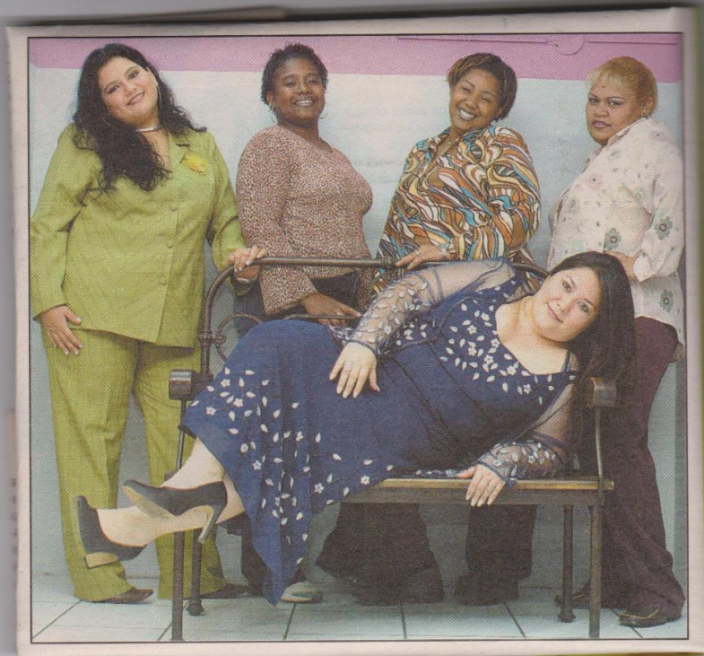
Gráfico N° 1: Mujeres con sobrepeso