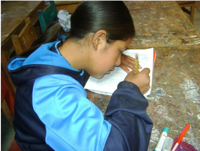
ALUMNA LLENANDO LA ENCUESTA