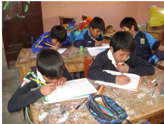
ALUMNOS LLENANDO LA ENCUESTA