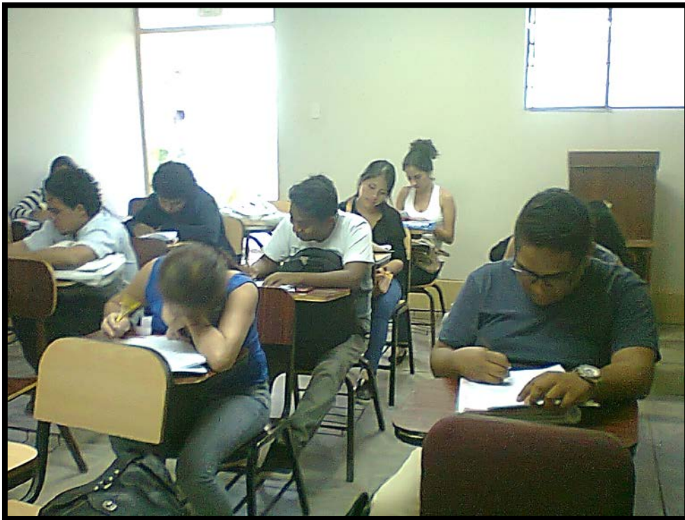
FUENTE: Propia del investigador Encuesta a los alumnos de la Universidad Alas Peruanas