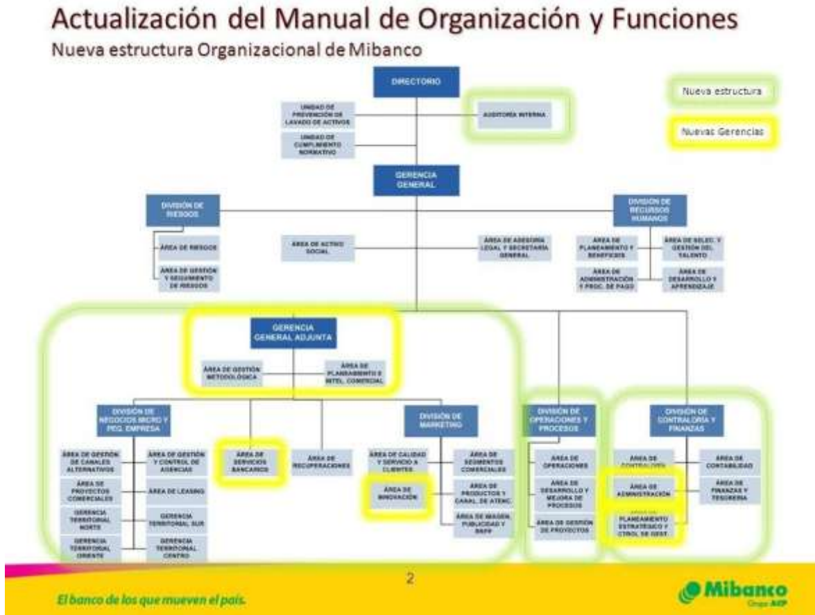
Figura 1: Organigrama de Mibanco