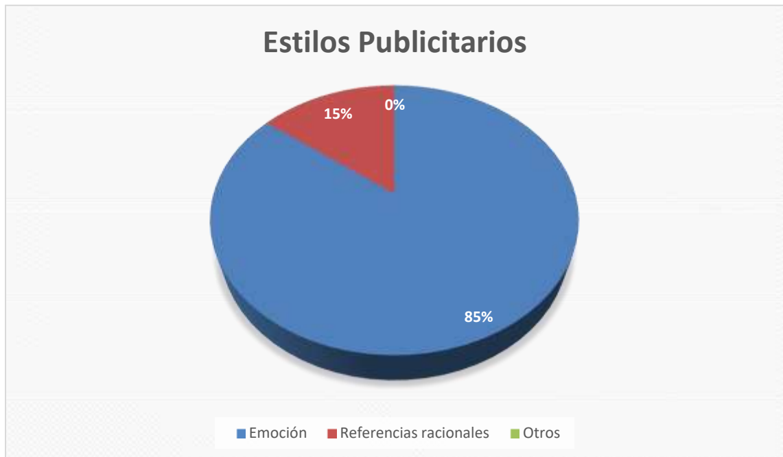
Figura 11: Estilos Publicitarios