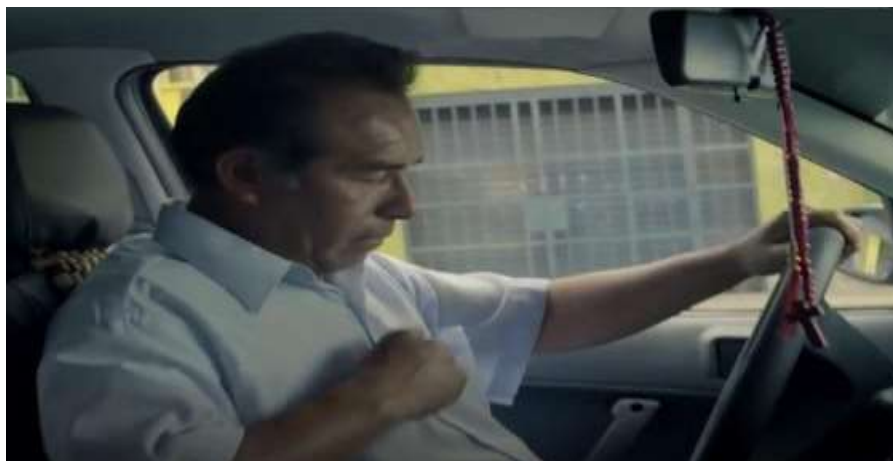
Figura 4: Símbolo Visual - Rosario

El spot utilizó El símbolo visual al mostrar en diferentes escenas las tradiciones y creencias de los peruanos, en este caso refleja símbolos religiosos como el de la cruz, las estampas religiosas, los santos.