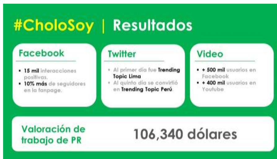
Figura 2: Resultados del spot Cholo Soy

El impacto generado logró captar rápidamente el interés de los diferentes medios de comunicación en prensa, radio y TV. La valorización del trabajo de PR se calcula en US$ 106,340 dólares (S/. 370,382 soles), logrado a través de la colocación de notas de prensa, entrevistas y crónicas en diferentes medios de comunicación masivo.