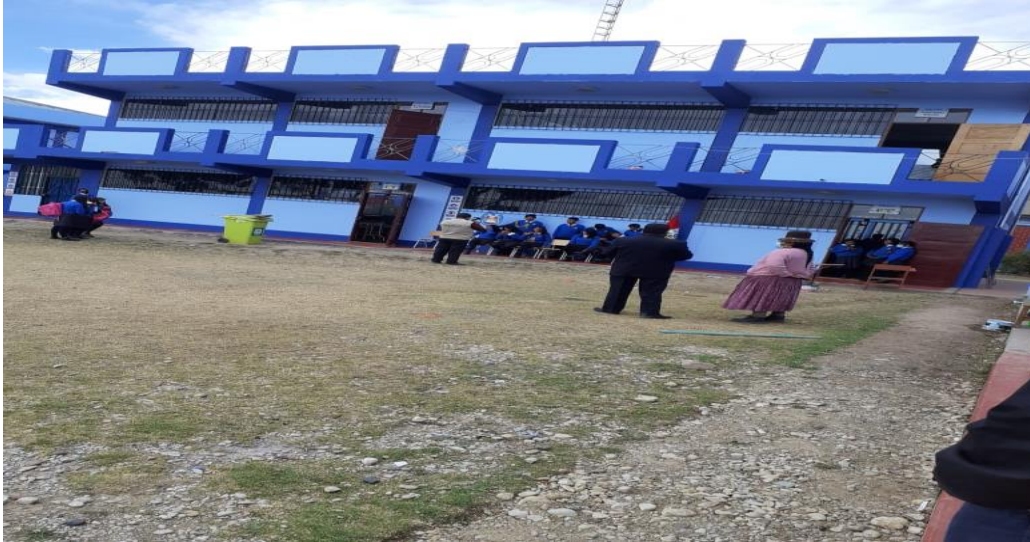
LA INSTITUCIÓN EDUCATIVA SECUNDARIA MANUEL NÚÑEZ BUTRÓN DE CENTRO POBLADO DE CHUCARIPO DEL DISTRITO DE SAMÁN - AZANGARO 2021