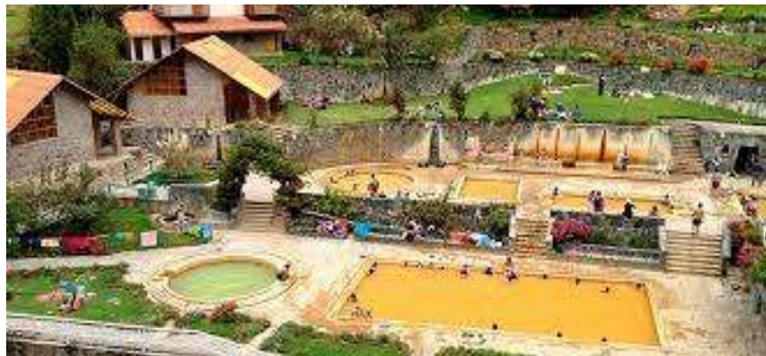
Figura 5 Baños Termales del Distrito de Lares

a. Baños termo medicinales: Es uno de sus atractivos naturales con mayor afluencia de turistas locales, nacionales y extranjeros. Poseen varias pozas con temperaturas que oscilan entre 36° y 44° C y el ingreso a este sitio tiene un costo aceptable entre S/. 5.00 a S/. 15.00.