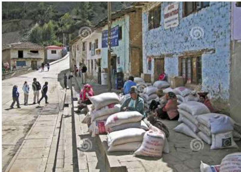
Figura 3 Edificaciones del Distrito de Lares

Las construcciones de las casas del distrito de Lares están edificadas en base a adobe, piedras, maderas y calamina. Las casas normalmente son utilizadas para la actividad productiva (crianza de animales) y no todas las viviendas cuentan con agua potable.