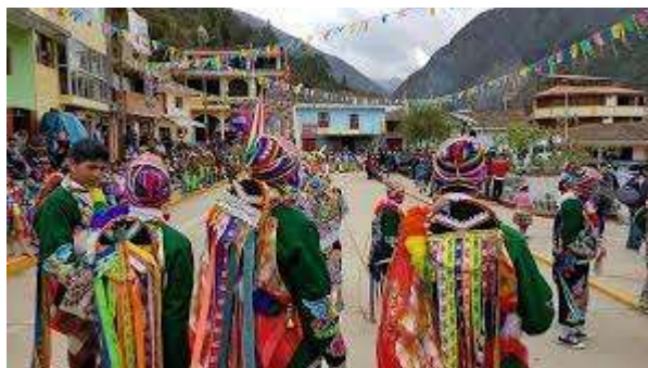
Figura 8 Danzas del Distrito de Lares