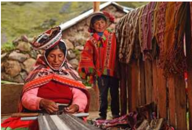
Figura 6 Tejidos del Distrito de Lares