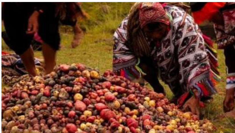
Figura 4 Variedad de Papas del Distrito de Lares