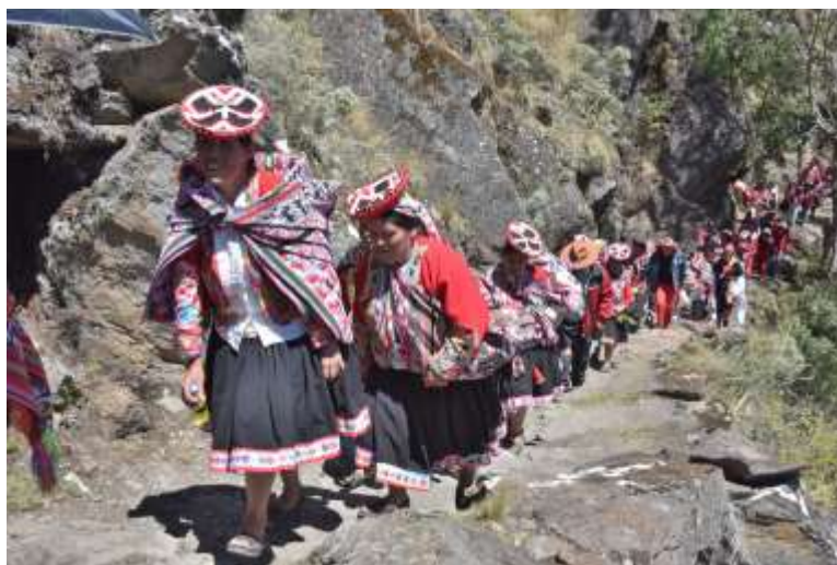
Figura 2 Población del Distrito de Lares

El distrito de Lares está organizado mediante centros poblados, comunidades y anexos el cual se dedican a la actividad agropecuaria. La lengua materna de los pobladores del distrito es el idioma quechua, seguido del idioma castellano, el cual es utilizado mayormente por los jóvenes. Así mismo, de acuerdo al censo realizado en el año 2007, el distrito de Lares tenía 7138 habitantes, de los cuales 3610 eran hombres y 3528 eran mujeres. (Espitia, 2020)