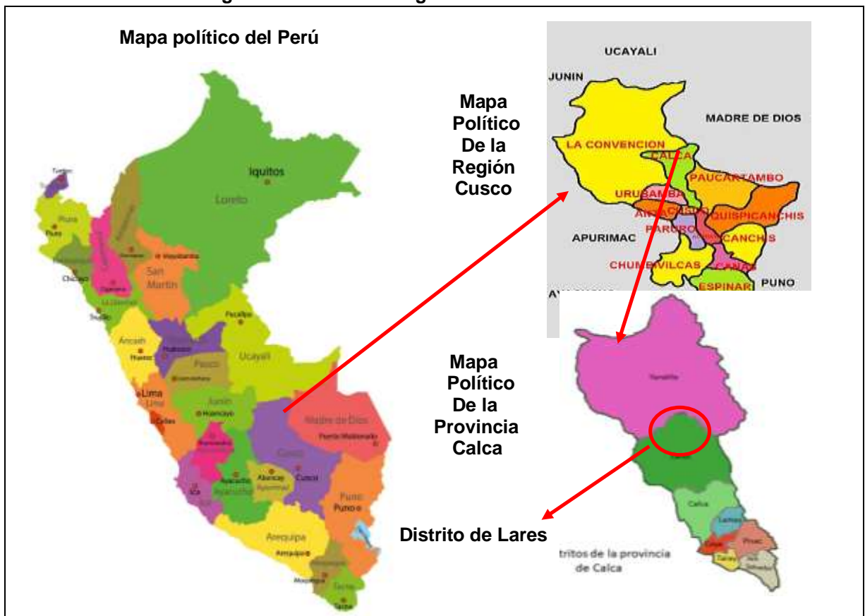
Figura 1 Ubicación Geográfica del Distrito de Lares