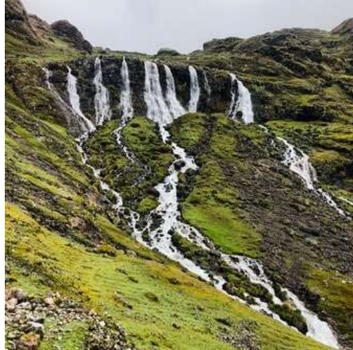
Figura 7 Cataratas de Qanchis Paccha – Lares