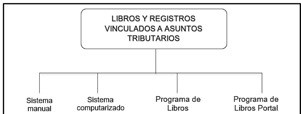
Figura 3. Formas de llevar libros y registros contables

Para el caso de aquellos asociados al Régimen General del Impuesto a la Renta, de acuerdo con el art 65 del decreto por el cual se rige, sus obligaciones están vinculadas a los libros y registros que le corresponden. Asimismo, en dicho decreto se menciona que la parte administrativa tributaria ha normado todos los elementos formales de los libros y registros como su legalización, formato y los datos a consignar (Empresarial, 2014).