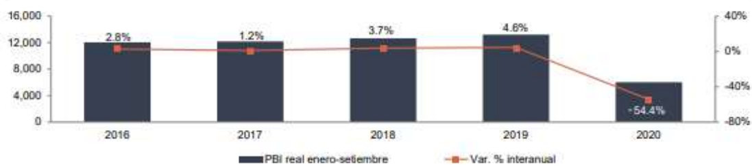
PBI del sector de alojamiento y restaurantes (S/ millones)