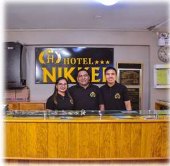
Equipo de trabajo del HOTEL NIKKEI S.A.C

El Hotel Nikkei abrió sus puertas con la finalidad de brindar el servicio de alojamiento y restaurant al público en general, busca tener un buen servicio y una variedad de platos exquisitos de todas las regiones, en especial los platos de nuestra querida Región.