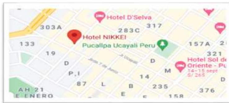
Figura 1 Plano de ubicación del HOTEL NIKKEI S.A.C

El HOTEL NIKKEI S.A.C. con número de RUC 20603341687, ubicado en Jr. Salaverry N.º 660 en la ciudad de Pucallpa-Ucayali, teniendo como actividad principal servicio de hotelería y cuenta con un restaurant llamado “El Fuego”.