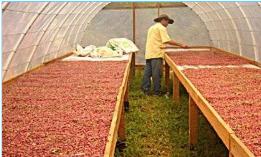
Cámara de secado solar