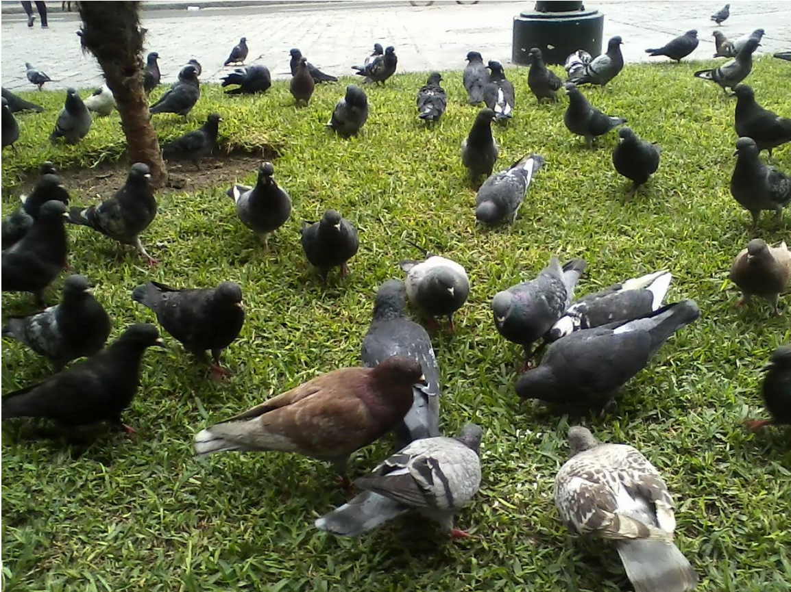
Figura: Paloma de Castilla ( Columba livia )