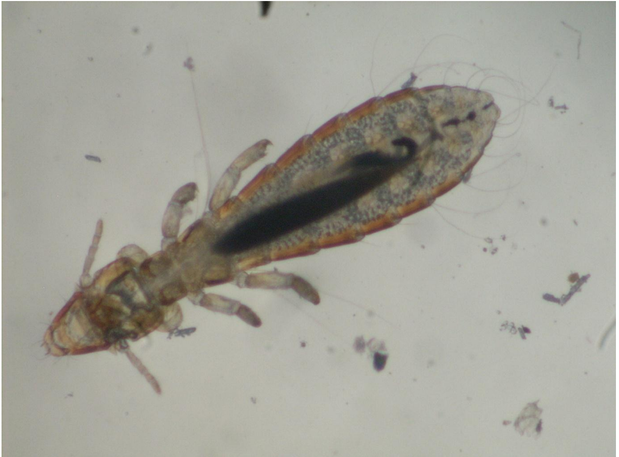
Figura: Imagen microscópica de Columbicola columbae