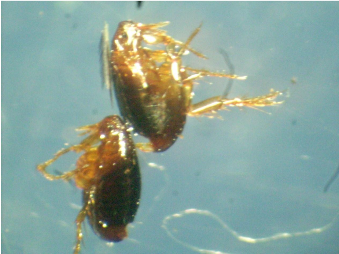
Figura: Imagen microscópica de Echinophaga gallinacea