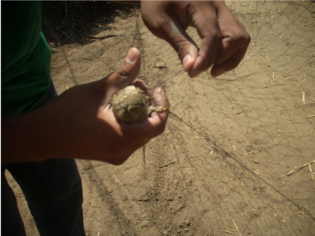
Figura: Retirando al ave de la red.