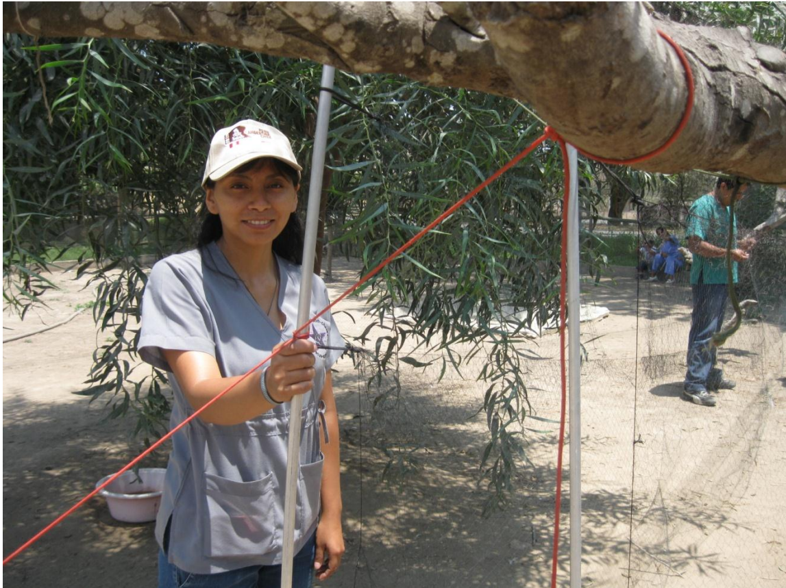
Figura: Colocación de redes para la captura de aves