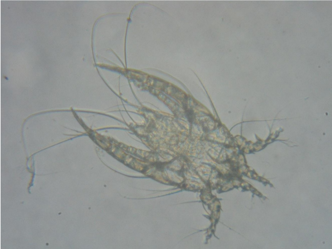
Figura: Imagen microscópica de Megninia sp.