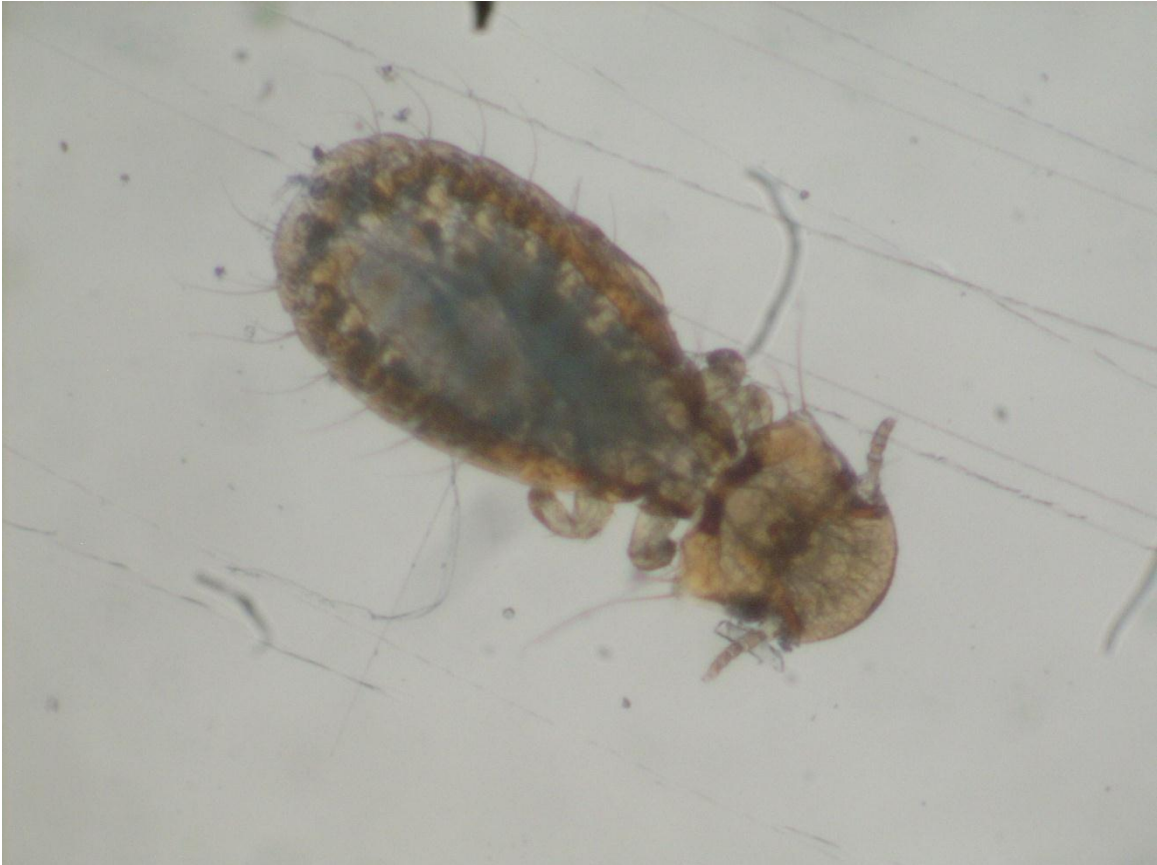
Figura: Imagen microscópica Menacanthus stramineus