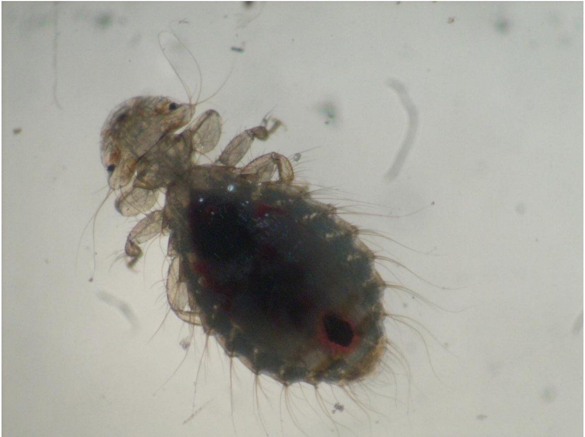
Figura: Imagen microscópica Menopon gallinae