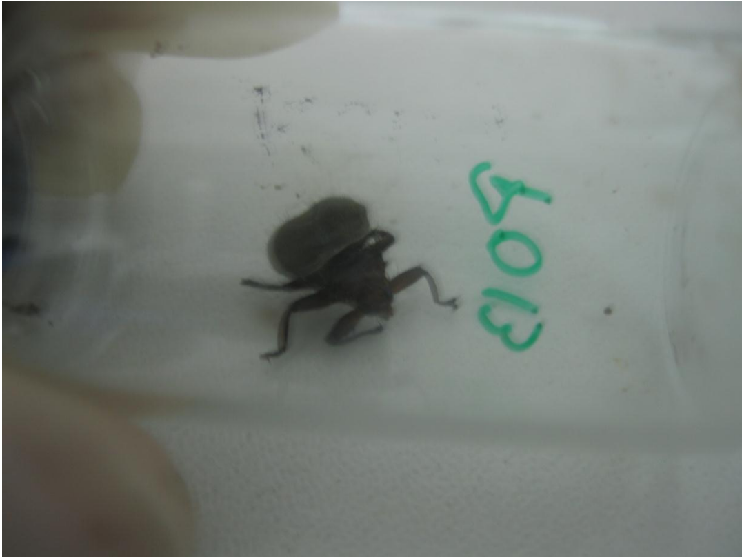
Figura: Imagen microscópica de Pseudolynchia canariensis