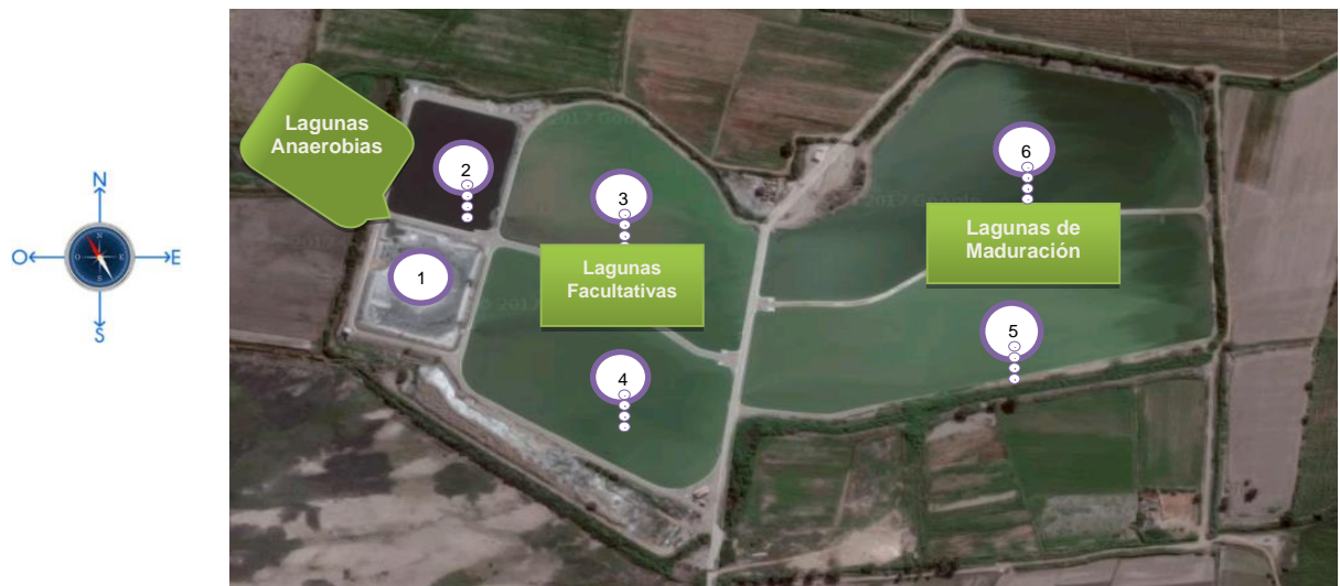
FIGURA 1. PLANTA DE TRATAMIENTO DE AGUAS RESIDUALES DE LA PROVINCIA DE PISCO

Esta Planta está a cargo de la Municipalidad provincial de Pisco a través de la Empresa de Agua Potable y Alcantarillado EMAPISCO.